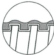
スクエアロックタイプ SQUARE LOCK TYPE